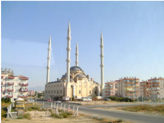
Een soort moskee waar we zijn gepaseerd met de bus