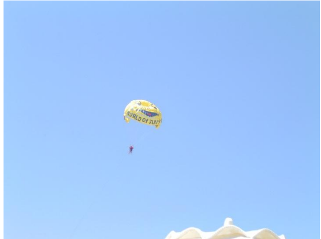
Papa is aan het vliegen .