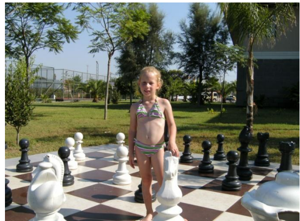
Mijn zus .